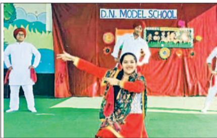
जीट। डीएन मॉडल स्कूल बैसाखी पर्व पर बच्चे डांस करते हुए।