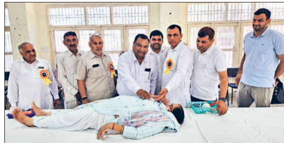
कैथल। रक्तदाताओं को बेज लगाते पदाधिकारी व मुख्य अतिथि।

जैसे अब पूरा किया जा रहा है। उन्होंने जानकारी देते हुए बताया कि तीन गलियों के निर्माण पर लगभग 17 लाख 50 हजार रुपये की लागत आएगी। गलियों के पक्का होने के बाद कॉलोनी के बच्चों को स्कूल जाने में सुविधा मिलेगी और आमजन को भी राहत मिलेगी।