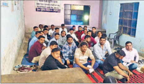
राजौड़। एचएसईबी वर्कर यूनियन के प्रांगण में आयोजित शोक सभा।