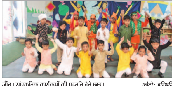
जीद। सांस्कृतिक कार्यक्रमों की प्रस्तुति देते छात्र।