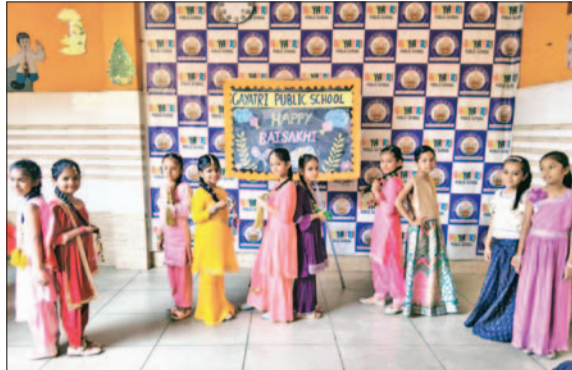
कैथल। कार्यक्रम प्रस्तुत करती गायत्री स्कूल की छात्राएं।