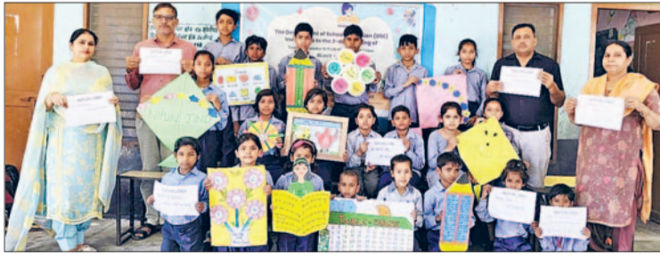
जीट। निपुण मिशन के तहत बैसाखी पर्व पर चार्ट बनाते बच्चे।