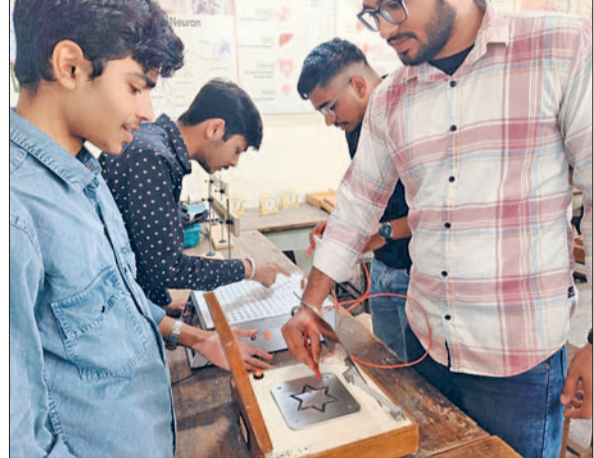
जीट। राजकीय महाविद्यालय में आयोजित एक दिवसीय कार्यशाला में विद्यार्थी उपकरणों की जानकारी लेते हुए।