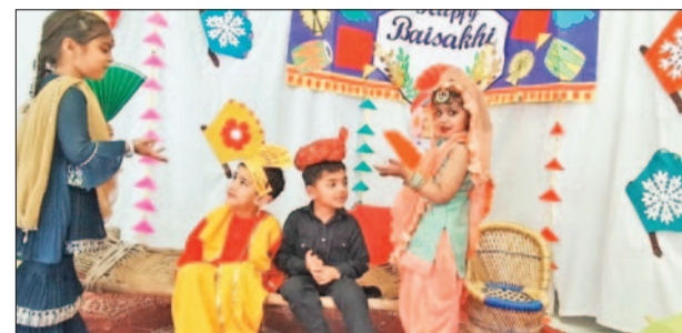
जीद। इंडस पब्लिक स्कूल में बच्चे बैसाखी पर्व पर प्रस्तुति देते हुए।