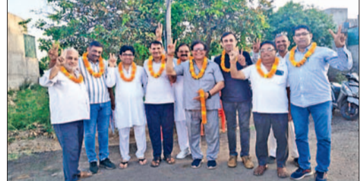
जीट। सेक्टर-6 के नवनिर्वाचित प्रधान व कार्यकारिणी।