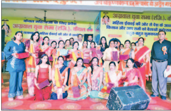
कैथल। अग्रवाल युवा सभा के पदाधिकारी महिलाओं व किशोरियों को सम्मानित करते हुए।